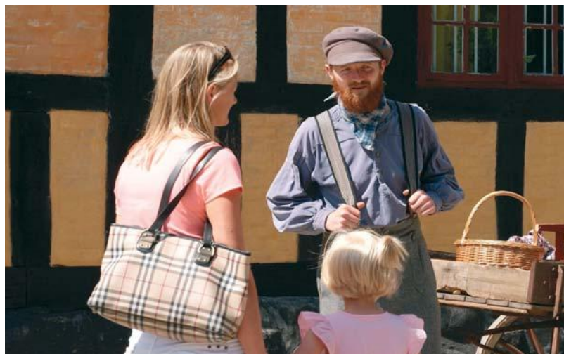
▲ "Næh, det er ikke nemt at tjene til husejen." Daglejeren prøver at sælge lidt fra vognen.

Hvordan kan det lade sig gøre i praksis? Kan man vende opgaverne på hovedet og starte med "hvorfor"? Kan formidlernes viden og praktiske erfaring inddrages, så formidlingen forankres i viden om hvordan museet bedst når ud til sine gæster?