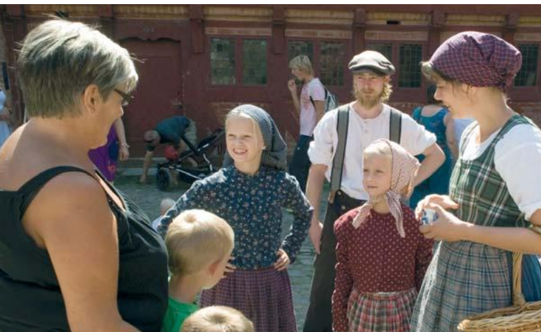
▲ "Vi lover, Frue, vi skal nok arbejde hårdt!" Aktører i snak med gæster på Torvet.